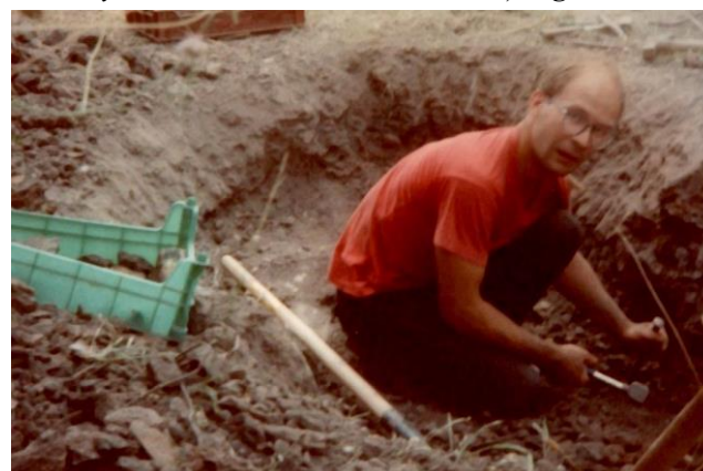
À Lodève en 1994, les blocs extraits ce jour-là livreront la deliensite et la leydetite !