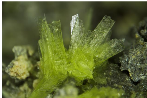
Leydetite - Mas d'Alary, Lodève, Hérault Champ 4 mm