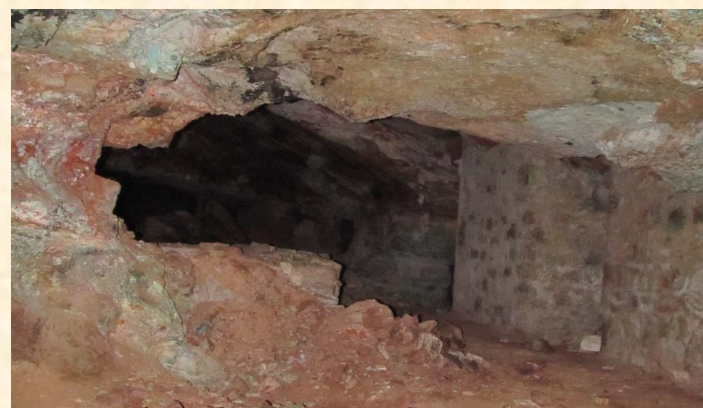
Un des lieux de découverte du matériel type : mine sud annexe S

Le matériel-type a été déposé dans les collections publiques du Museum Victoria, Melbourne (Australie), du Natural History Museum of Los Angeles County, Los Angeles (USA) et du Muséum National d'Histoire Naturelle de Paris (France).