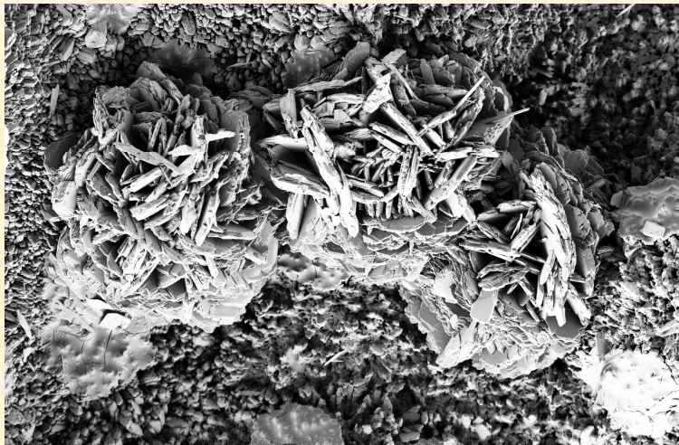
Agrégats de forêtite (0,1 mm), matériel type

La forêtite (IMA 2011-100) est un nouvel arséniate de cuivre et d'aluminium répondant à la formule :