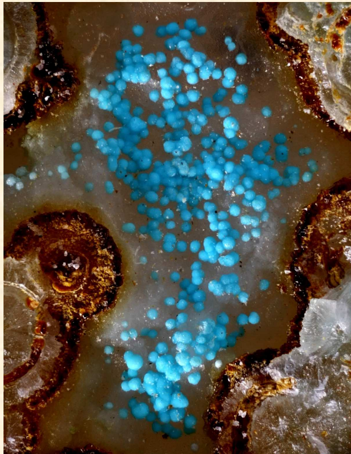
Forêtite, Cap Garonne mine sud, champ 5 mm