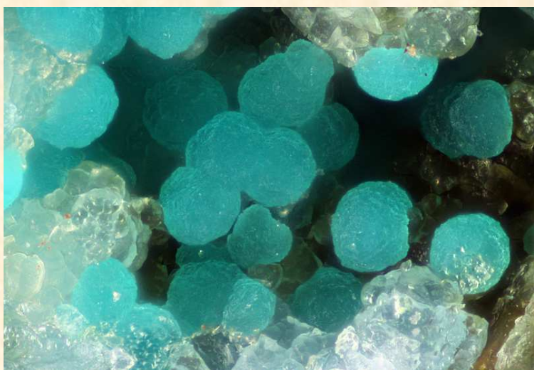
Forêtite, Salsigne, champ 1 mm

Le minéral a simultanément été décrit sur d'anciens échantillons provenant de la mine de Salsigne (Aude).